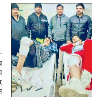
पानीपत। एंकाउंटर करने वाली पुलिस टीम व घायल बदमाश।