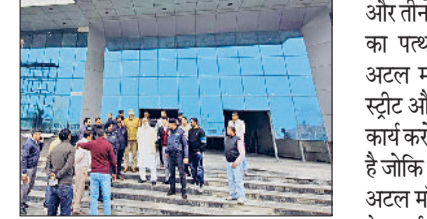
अंबाला। मंत्री अनिल विज अटल मॉल का निरीक्षण करते हुए।

अंबाला छावनी के तीन बड़े प्रोजेक्ट अटल मॉल एंड बैंक स्क्वेयर, नाइट फूड स्ट्रीट और फायर ब्रिगेड बिल्डिंग का निर्माण जल्द पूरा होने वाला है। इनके निर्माण पर करीब 200 करोड़ रुपये खर्च होंगे। मंत्री अनिल विज ने इन प्रोजेक्ट्स के निर्माण कार्य का निरीक्षण करते हुए नगर परिषद अधिकारियों व निर्माण एजेंसियों को दिशा-निर्देश दिए। उन्होंने कहा अंबाला छावनी की जनता की सुविधा हेतु इन तीन बड़े प्रोजेक्टों पर निर्माण कार्य चल