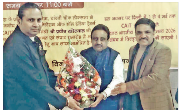
पानीपत। कॉन्फेडरेशन ऑफ ऑल इंडिया ट्रेडर्स के राष्ट्रीय महामंत्री व सांसद प्रवीण खंडेलवाल का स्वागत करते हुए उद्यमी।

पवं टेक्स इंडिया गांव बापौली में सनौली-बापौली ब्लॉक सहित जिले के कंबल, चार्ड फैक्टरियों के व्यापारियों की बैठक मुख्यातिथि कॉन्फेडरेशन ऑफ ऑल इंडिया ट्रेडर्स के राष्ट्रीय महामंत्री एवं दिल्ली चांदनी चौक के सांसद प्रवीण खंडेलवाल के साथ हुई। वहीं सांसद खंडेलवाल ने कहा कि देश और प्रदेश के व्यापारियों को सुरक्षा एवं सम्मान की लड़ाई सड़क से लेकर संसद तक जारी रहेगी। वहीं, एक से चार मई को दिल्ली में होने वाले भारतीय व्यापार महोत्सव को लेकर विचार से चर्चा की है। वहीं, सांसद खंडेलवाल ने कहा कि केंद्र और प्रदेश सरकार, व्यापारियों के लिए मेक इन इंडिया तेजी से आगे