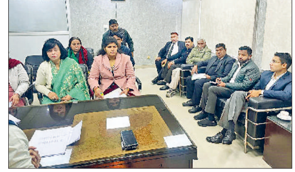
करनाल। मतदाता सूची पुनरीक्षण को लेकर बैठक करते प्रशासनिक अधिकारी।