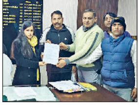
करनाल। ज्ञान सौंपते नॉन टीचिंग कर्मचारी प्रतिनिधि।