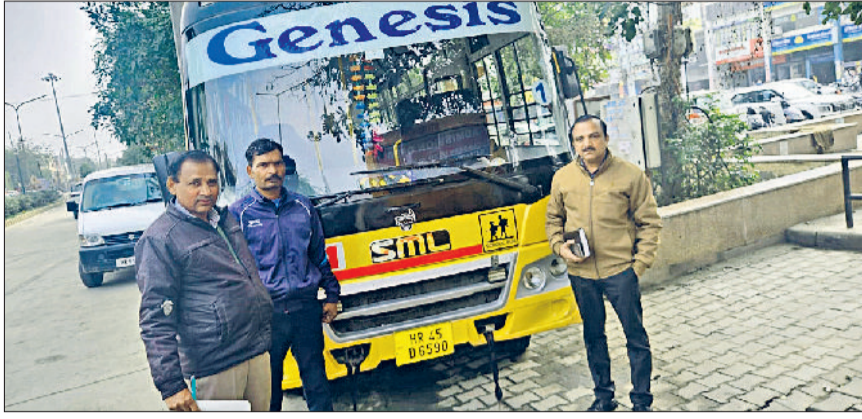
करनाल। स्कूली बसों की जांच करती विशेष टीम।