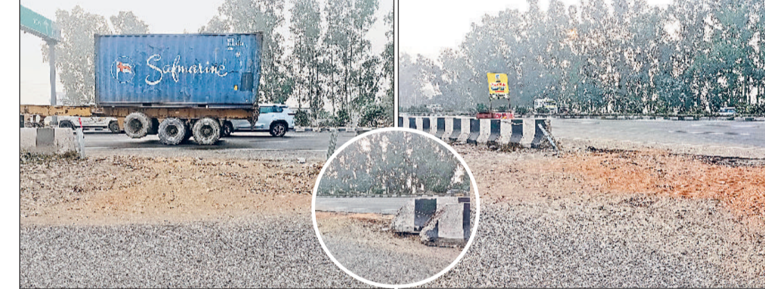
घरौंडा। नेशनल हाईवे-44 पर खुले अवैध कट।

एनएचआई की ओर से दी गई शिकायत में बताया गया है कि घरौंडा से पानीपत की ओर जाते समय एचपी पेट्रोल पंप, आशीर्वाद ढाबा, गुरुकृपा कार वॉश, ब्रेक प्राइवेट ढाबा, न्यू बाबा ढाबा, भारत पेट्रोलियम और भारत पेट्रोलियम (सीएनजी माटिया) के सामने अवैध कट पाए गए हैं। इसके अलावा द अर्बन विलेज रेस्टोरेंट के सामने भी अवैध कट बनाए जाने की पुष्टि की गई है। करनाल जिले के घरौंडा क्षेत्र से गुजर रहे नेशनल हाईवे-44 पर बनाए गए अवैध कट सड़क दुर्घटनाओं का बड़ा कारण बनते जा रहे हैं। इस गंभीर समस्या को लेकर नेशनल हाईवे अथॉरिटी ऑफ इंडिया (एनएचआई) ने सख्त रुख अपनाते हुए हाईवे की सरकारी संपत्ति को नुकसान पहुंचाने और यातायात सुरक्षा से खिलवाड़ करने के आरोप में कई ढाबा और पेट्रोल पंप संचालकों के खिलाफ थाना घरौंडा में मुकदमा दर्ज कराया है। पुलिस ने मामले की जांच शुरू कर दी है।