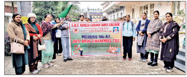
बराड़ा। रेली को हरी झंडी दिखाकर रवाना करते हुए प्रिसिपल।