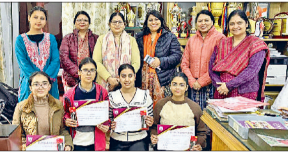
करनाल। अंतर-महाविद्यालयी प्रतियोगिता की विजेता छात्राएं।