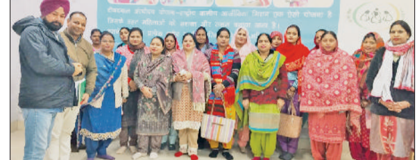
बराड़ा। कार्यक्रम में उपस्थित महिलाएं।