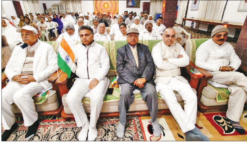
अंबाला। कार्यक्रम में मौजूद वीके बहनें व भाई।